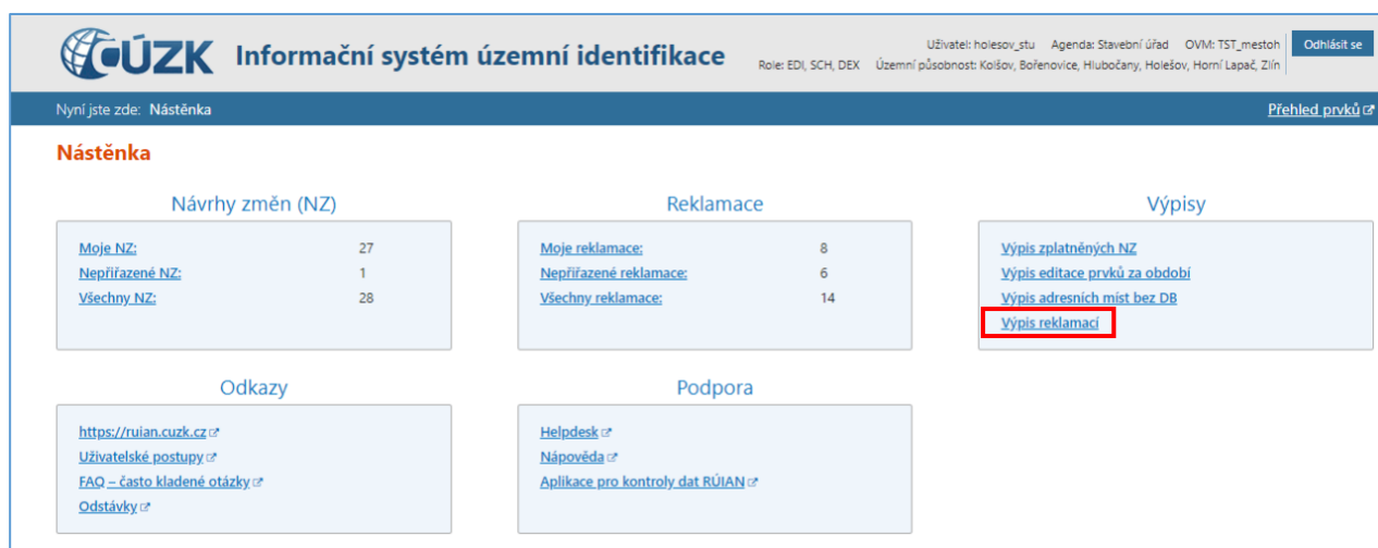
Obr. 9: Úvodní obrazovka ISÚI (Nástěnka) - Výpis reklamací v bloku Výpisy

Ve „Výpisu reklamací“ si krajské úřady mohou vyhledat reklamacie všech kontrolovaných OVM a nahlížet na jejich detaily (viz obr. 10). Jedná se nejen o reklamacie přidělené ke zpracování (k řešení), ale také ty již zpracované.