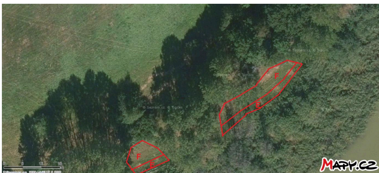
Obr. 2 Umístění managementu v dílčích plochách E, F na louce u Zákopského rybníka

Kosení travního porostu a rozrůstajících se rákosin na louce u Zákopského rybníka na části pozemku p. č. 580, k. ú. Lukavec u Hořic ve dvou sečích (obr. 2, plocha E – kosení 15.6.–30.6., plocha F – kosení 15.8.–15.9.). Kosení bude provedeno křovinořezem nebo ručně vedenou sekačkou. Veškerá vzniklá biomasa spolu se stařinou bude důkladně vyhrabána a odvezena z území přírodní památky Byšičky 1 a jejího ochranného pásma. Částečné plnění díla, tj. pokosení bez odklizení biomasy vždy po každé seči z obou celých ploch E a F, nemá pro objednatele význam a nebude převzato jako částečné plnění.