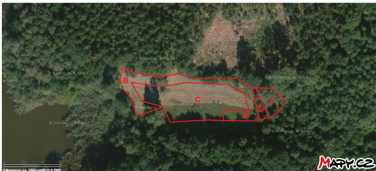
Obr. 1 Umístění managementu v dílčích plochách A–D na slatině louce u rybníka Bahník

Kosení travního porostu slatinných luk a rozrůstajících se rákosin na části pozemku p. č. 599, k. ú. Lukavec u Hořic ve dvou sečích (obr. 1, plocha B – kosení 15.6.–30.6., plocha A, C, D – kosení 15.8.–15.9.). Kosení bude provedeno křovinořezem nebo ručně vedenou sekačkou. Veškerá vzniklá biomasa spolu se stařinou bude důkladně vyhrabána a odvezena z území přírodní památky Byšičky 1 a jejího ochranného pásma. Částečné plnění díla, tj. pokosení bez odklizení biomasy vždy po každé seči ze všech ploch A - D, nemá pro objednatele význam a nebude převzato jako částečné plnění.