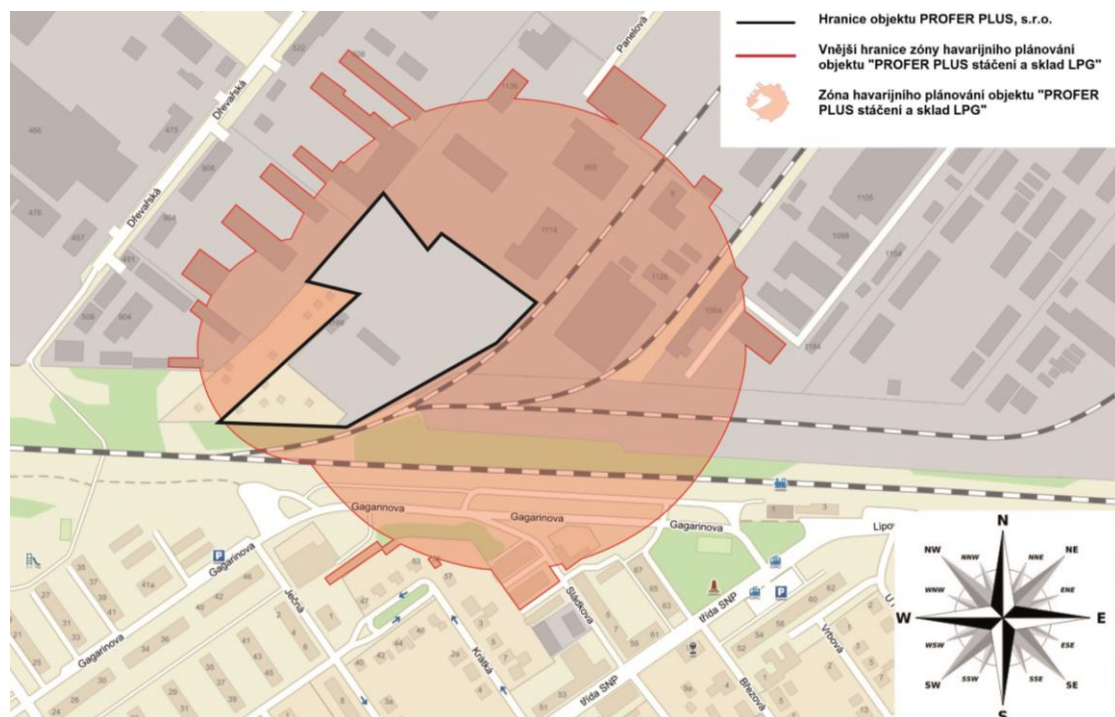
Obr. 1: Zóna havarijního plánování, pro kterou je zpracován vnější havarijní plán

Dodržujte pokyny a příkazy složek integrovaného záchranného systému v průběhu havárie.