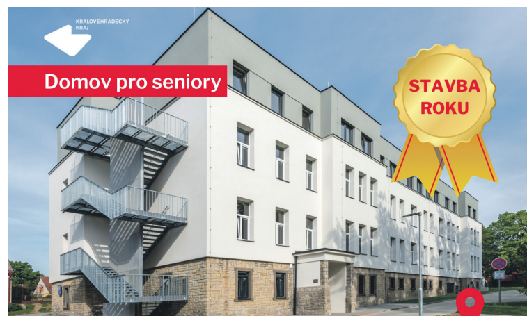
Stavba roku Královéhradeckého kraje 2022

V loňském ročníku se o titul ucházelo 19 staveb. Stavbou roku se stala přestavba bývalé porodnice a chirurgie na domov pro seniory v Opočně, krajskou dopravní stavbou rekonstrukce ulice Hlavní