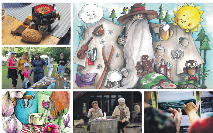
POMOC KRÁLOVÉHRADECKÉHO KRAJE V DOBĚ VYSOKÉ INFLACE A ENERGETICKÉ KRIZE V SOCIÁLNÍ OBLASTI