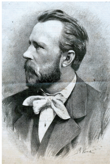
Julius Grégr

„Počátky zájmu Julia Grégra o politické dění úzce souvisí se založením Národních listů. Byl jejich redaktorem a po roce i majitelem. Aktivní působení v tomto vlivném českém, politicky orientovaném deníku, představovalo pro Grégra značné riziko. Jeho uvěznění v roce 1862 na 10 měsíců za tiskové přečiny vyvolalo vlnu solidarity. Stovky obcí mu vyjádřily podporu a více jak dvě desítky měst udělily čestné občanství. Osobnost Julia