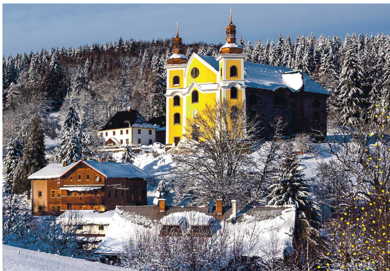
kostel Nanebevzetí Panny Marie v Neratově