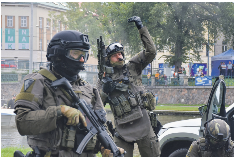
Během simulovaného zásahu proti aktivnímu střelci členové zásahové jednotky signalizují, že je bezpečno a pro zraněné mohou přijet záchranáři.

Na začátku září se v Hradci Králové uskutečnila oblíbená prezentační akce IZS v regionu. Záchranáři, hasiči i policisté a jejich partneři představili to nejzajímavější ze své techniky a práce. Na náplavce mohli diváci vidět ukázky schopností policejních psů, hořící pánvičku i spolupráci složek IZS u dopravní nehody a při zásahu proti aktivnímu střelci. Akci uspořádal Královéhradecký kraj ve spolupráci se složkami IZS. |