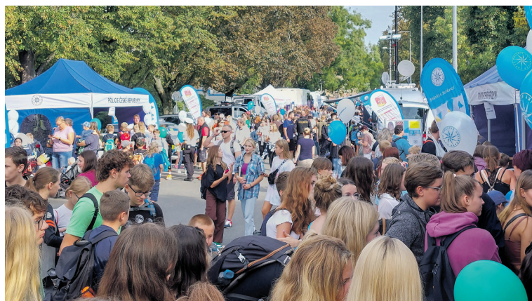
Akce se v letošním roce zúčastnilo zhruba 3 000 návštěvníků.