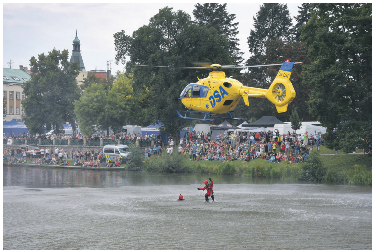
Jeden z vrcholů dynamických ukázek na Bezpečném nábřeží – záchrana tonoucího z vody vrtulníkem letecké záchrané služby.