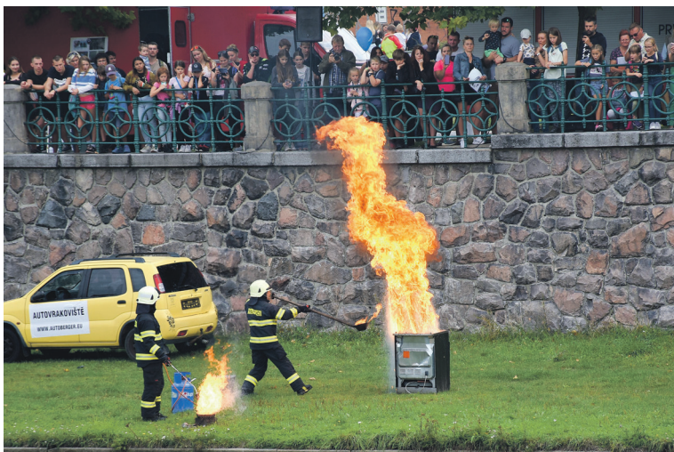
Takhle to dopadne, když hořící olej na pánvi chcete uhasit vodou. Nikdy to takhle nedělejte! Pánvičku stačí přikrýt pokličkou nebo vlhkou utěrkou a je po ohni.