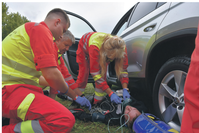
Záchranáři při simulované ukázce ošetřují zraněného muže, kterého postřelil útočník na ulici. Prostor nejprve museli zabezpečit policisté, poté povolali na místo i záchranáře.