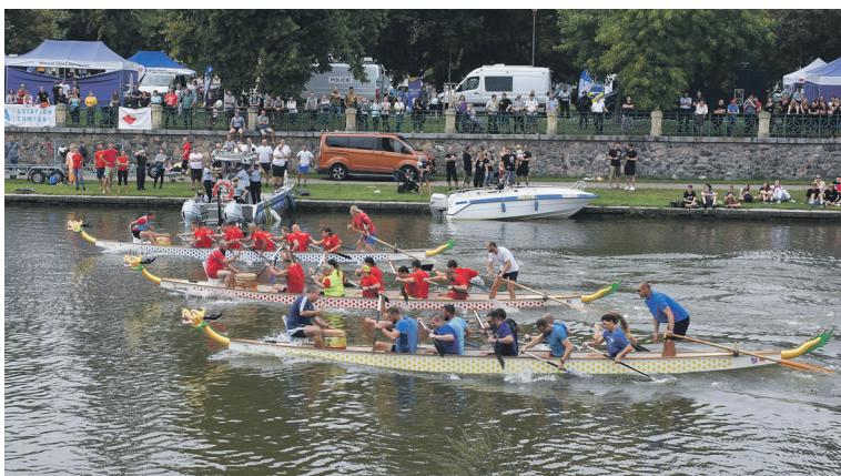
Na Labi během Bezpečného nábřeží závodily posádky dračích lodí složené z příslušníků jednotlivých složek.